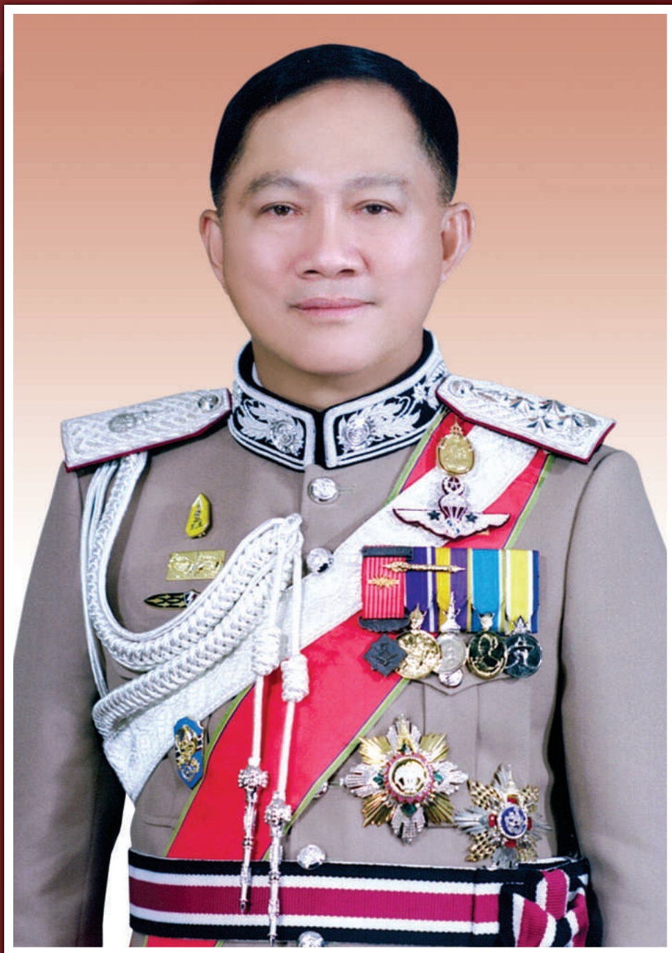
พลตำรวจเอก อุดุลย์ แสงสิงแก้ว ผู้บัญชาการตำรวจแห่งชาติ